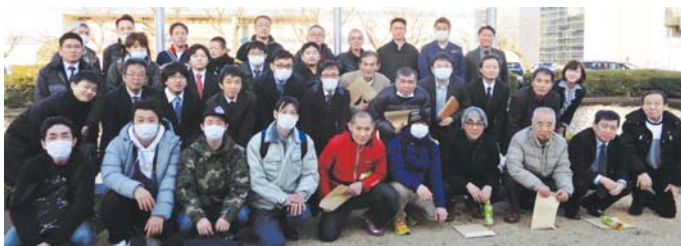
いすゞ自動車 藤沢工場前にて

昨今セキュリティの関係などでなかなか見学ができない工場でもあり、参加者の皆様方には満足していただけた一日になったとの感想を頂くことが出来ました。