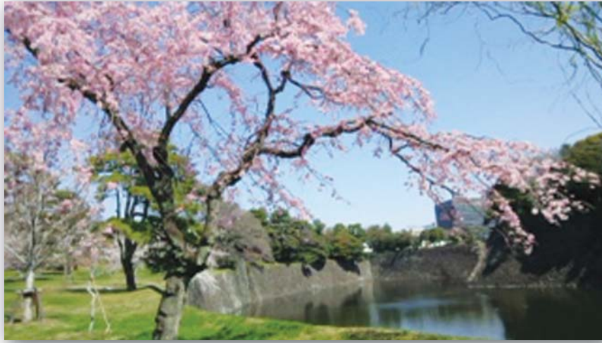
写真は3月25日 皇居まえにて撮影

〒210-0001 川崎市川崎区本町2-11-19 TEL 044-233-8367 fax 044-246-5265 E-mail:wes-kana@aioros.ocn.ne.jp web:http://www.jwes-kanagawa.jp