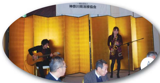
祝賀会でのサクソとギターの演奏