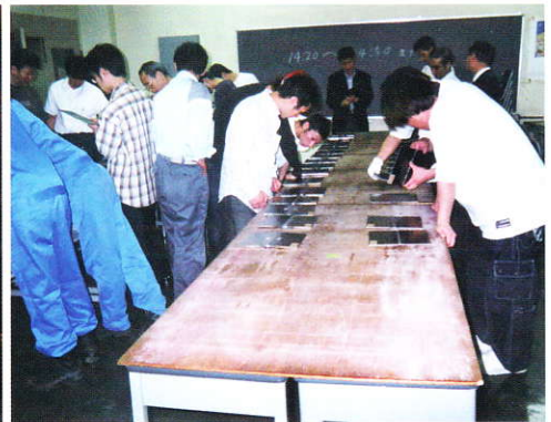
競技後の作品を見る選手