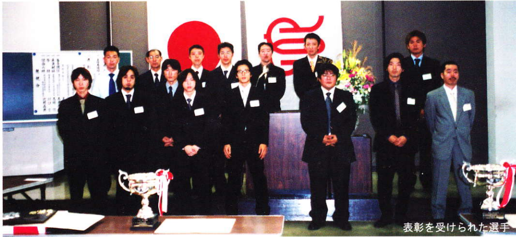
表彰を受けられた選手