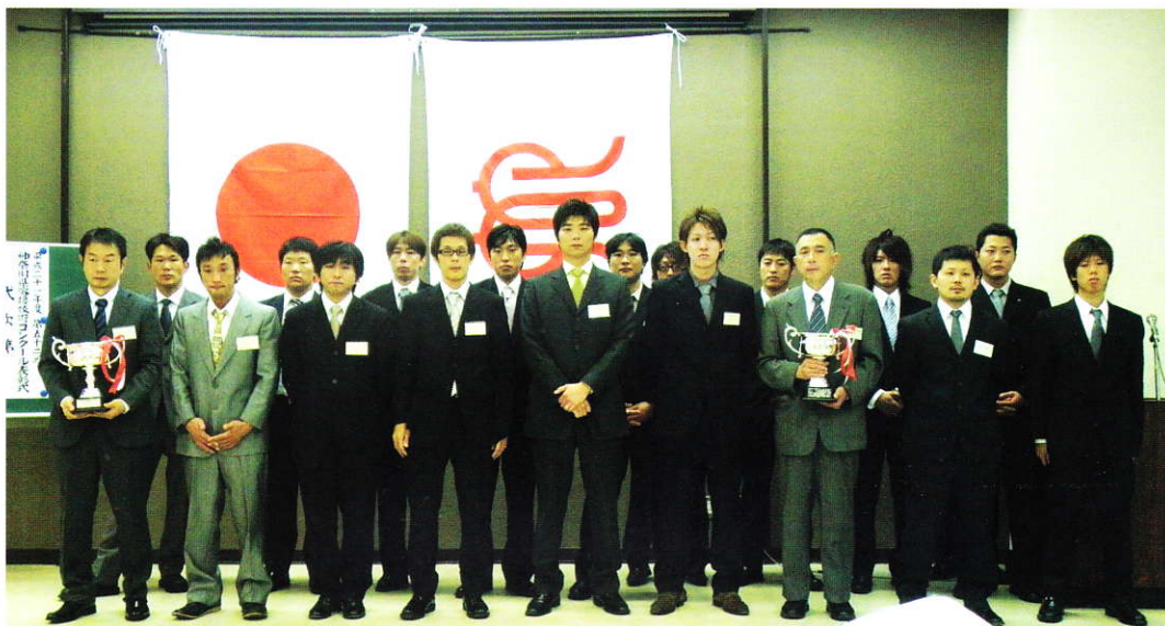
9月9日表彰式に出席された入賞者の皆さん